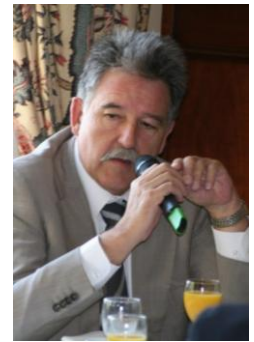
Richard Mallié, Député des Bouches du Rhône, 1 er Questeur de l'Assemblée Nationale