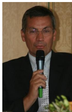
Patrice Calmejane, Député-maire De Villemomble (93)